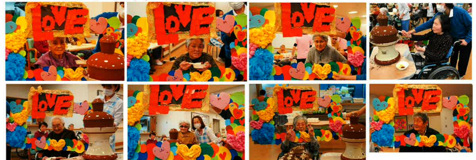
インスタ映えするようにみんなでハイチーズ♡ ならぬハイチョコフォンデュ♡