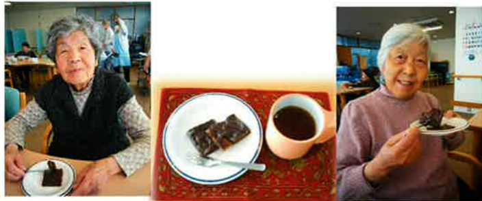
バレンタインチョコをみんなで作りました。 誰にもあげずに食べちゃった(*´艸`)