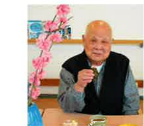
桜餅とひなあられでお茶会。 お雛様たちと一緒にちょっぴりお澄まし顔でパチリ。