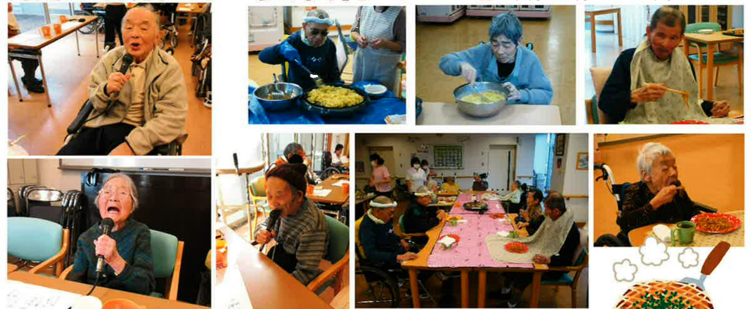
皆さん自慢の歌を披露しました。最初は遠慮してましたが、なかなかマイクを離さない方も…楽しかったですね。