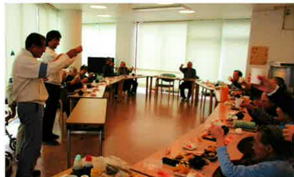
今年の新年会はスシローのお寿司をいただきました。皆さんの抱負を職員が筆で書きました。良い年になりますよーに！