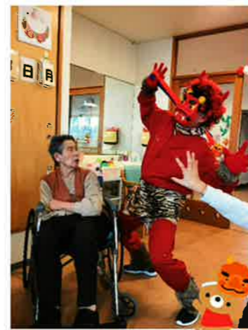
鬼は外！ 福は内！ 今年も皆さんで元気に鬼退治！ あれあれ、鬼さんが増えてる？