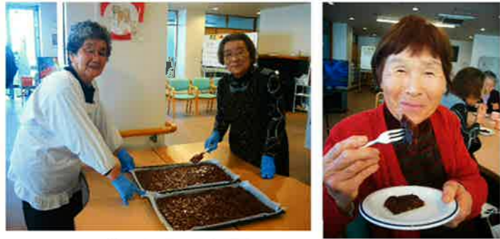
アップルブラウニーケーキ