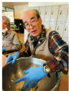
希少なバターとみんなの好きなレーズンを組み合わせました！