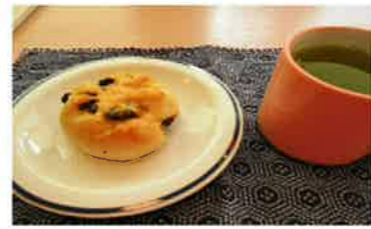
カルピスバターのレーズンパン