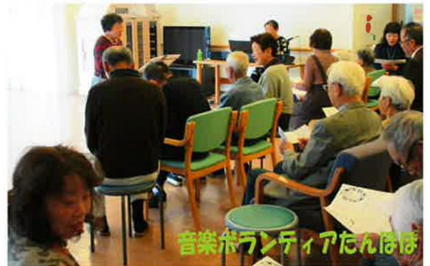
音楽ボランティアたんぽぽ