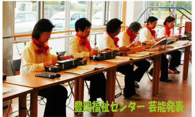
豊岡福祉センター 芸能発表